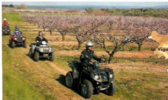
Lors de notre virée près d'Uzès, la végétation était en réveil total et les abricotiers en timide fleuraison.